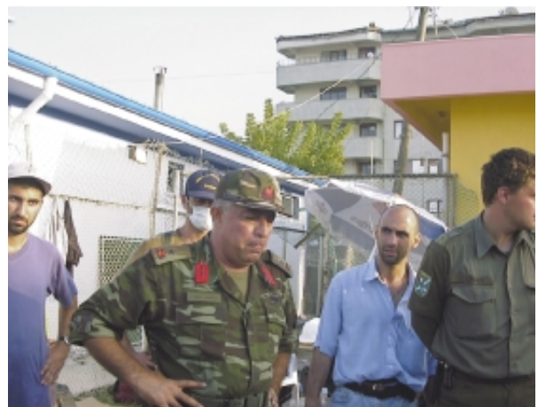
災害対策本部の救助活動の最高責任者との会談

このため、14時を以て翌日からは早番と遅番で交代して万全の活動態勢を確保することとし、これに伴い、先遣隊の多くを早番に指定し、15時を以て宿泊場所に移動開始し待機態勢を取らせると共に、残りの隊員を遅番に指定し救助活動を継続すること