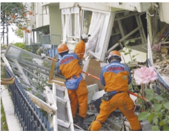
人命検索の様子(真中は外国救助犬チームのハンドラー)

5分ほどで要救助者1名(死亡)を発見したことから、そこを活動地点として検索救出作業を行うこととし、後発隊の残りとは本部基地に帰還した先発隊とが順次投入されました。