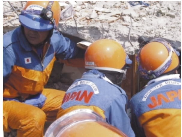
74歳の女性の救出作業