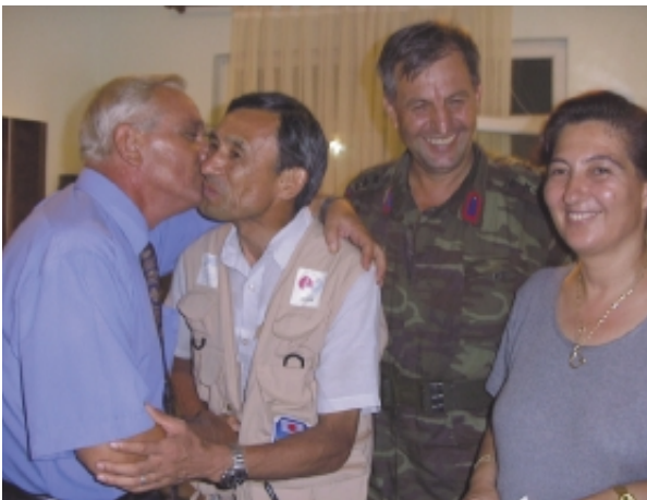
知事と会見の後で（左から知事、団長、軍幹部、警察本部長）

・発災後110時間を超えた18時30分頃、NGOの連絡調整本部で外国チームの調整役を任じていたオーストリアチームのリーダーから、生存者発見の最後の機会として翌日未明までの捜索活動を計画しており、日本チームの参加方呼びかけがありました。